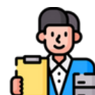
Alta inserción laboral