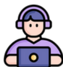
Acceso 24 h.